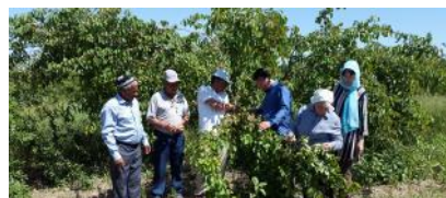
Лойиҳа доирасида Сурхондарё вилояти Термиз туманидаги ўриқнинг маҳаллий навларига шакл бериш жараёни билан танишиши

Тошлоқ ерларда ўриқлар 10-12 ёшидаёқ озроқ икки-тўрт йиллик шохлари, 17-20 ёшида эса беш-олти йиллик қалин шохлар ва шаббалар кесиб ёшартирилади, шунингдек 30-35 ёшида эса етти-саккиз йиллик шохлар қиркилади.