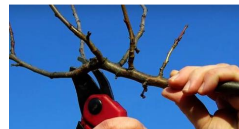
Ўрик новдаларини қирқиши ва шохга шакл бериш

Лойиҳа Миллий Агентлиги: Академик М.Мирзаев номидаги боғдорчилик, узумчилик ва виночилик илмий-тадқиқот институти Манзил: 111116, Тошкент вилояти, Тошкент тумани, Гулистон қишлоғи, Чимкент йўли кўчаси Телефон: (+99871) 220-24-42, (+99871) 220-26-82; Факс: (+99871) 220-26-48 Электрон почта: buviti@mail.ru, meva-uzum@exat.uz Тузувчилар: Х.Ч.Бўриев, Ш.М.Ахмедов, П.Т.Назаров, А.Қ.Қайимов умумий таҳрири остида.