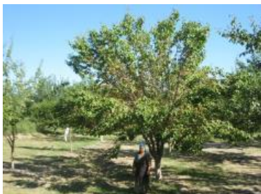
Хоразмдаги маҳаллий ўрик дарахтларига кўп лидерли усулда шакл бериш тажрибаси (Хоразм вил., Урганч тум.)

Ўрик дарахти данакли мева турларига мансуб бўлиб, данакли мева дарахтлари кўпинча 3-4 йили ҳосилга киради, эскироқ шохларда шакланган ҳосил новдалари эса уруғли меваларга нисбатан унча кўп яшмайди, натижада шохлар ичи тезда бўликка айланади. Бунга йўл қўймаслик учун буташ йўли билан ҳар йили кўплаб бир йиллик новдалар ўсиб чиқиши ва уларни шохлар орасига тўғри жойлаштириб, ҳосил туғишига эришиш зарур. Шохлар буталганда бир йиллик новдалар сони кўпаяди ва агар у ёруғда жойлашган бўлса, мева шаклланишига кўмаклашади.