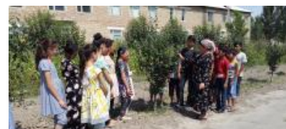
Лойиҳа доирасида ўрик дарахтларига шакл бериш бўйича "Ёш селекционерлар мактаби" ўқувчиларига давс йтиши тадбири